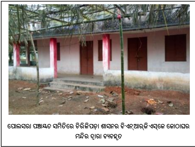
ପୋଲସରା ପଞ୍ଚାୟତ ସମିତିରେ ଚିରିକିପଡ଼ା ଶାସନର ବିଏନ୍ଆରଜିଏସ୍‌କେ କୋଠାଘର ମନ୍ଦିର ଦ୍ୱାରା ବ୍ୟବହୃତ

ମାଗାଁଘାଇ ପୋଲିସ୍ ଷ୍ଟେସନର ଇନସ୍ପେକ୍ଟର ଇନ୍ ଚାର୍ଜଙ୍କ ଅନୁରୋଧ କ୍ରମେ କୋଠାଘର ଆବଶ୍ୟକ କରାଯାଇଥିବା କଥା ବିଡିଓ, ମାଗାଁଘାଇ ବ୍ୟକ୍ତ କରିଥିବା (ସେପ୍ଟେମ୍ବର 2019) ବେଳେ, ଡେରାବିଶ ଏବଂ ଆଳିର ବିଡିଓ ମାନେ କୋଠାଗୁଡ଼ିକୁ ଅନୁଧିକୃତ ଦଖଲରୁ ମୁକ୍ତ କରିବା ନିମନ୍ତେ ପଦକ୍ଷେପ ଗ୍ରହଣ କରିବା ବିଷୟ ବ୍ୟକ୍ତ କରିଥିଲେ । ପୋଲସରା ବିଡିଓ ଅତିରକ୍ତ କୌଣସି