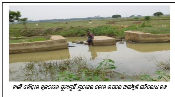
ଟାଙ୍ଗି ଚୌଦ୍ୱାର ବ୍ଲକରେ ସୁନାମୁହିଁ ମୁଣାକର କୋର ଉପରେ ଅସମ୍ପୂର୍ଣ୍ଣ ଗତିରୋଧ ବନ୍ଧ

ଅତିବ୍ ମଧ୍ୟ ଦେଖିବାକୁ ପାଇଥିଲା 30.53 ଲକ୍ଷ ଟଙ୍କା ବ୍ୟୟ ହେଲା ପରେ 11 ଟି ଚେକ୍ ଡ୍ୟାମ୍ ସମ୍ପୂର୍ଣ୍ଣ ହେବାର ଧାର୍ଯ୍ୟ ତାରିଖ 75 ଠାରୁ 18 ରୁ 72 ମାସ ପର୍ଯ୍ୟନ୍ତ ଅସମ୍ପୂର୍ଣ୍ଣ ଅବସ୍ଥାରେ ପଡ଼ିରହିଥିଲା ( ପରିଶିଷ୍ଟ 2.7.2 ) । ଯଦିଓ ଅତିବ୍ କାର୍ଯ୍ୟ ସମ୍ପୂର୍ଣ୍ଣ ନ ହେବାର କୌଣସି ନଥିବୁକ୍ତ କାରଣ ପାଇନଥିଲେ, ସଂପୃକ୍ତ ବିଡିଓ ପ୍ରକଳ୍ପ କାର୍ଯ୍ୟର ସମୟାନୁଯାୟୀ ଅଗ୍ରଗତିକୁ ପର୍ଯ୍ୟବେକ୍ଷଣ କରିନଥିବା ଦେଖାଯାଇଥିଲା । ଫଳସ୍ୱରୂପ