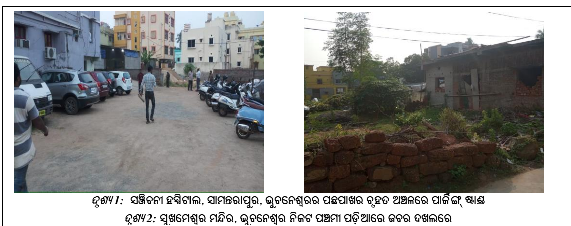
ଫିଗ୍ୟୁର 1: ସଞ୍ଜିବନୀ ହସିଗାଲ, ସାମନ୍ତରାପୁର, ଭୁବନେଶ୍ୱରର ପଛପାଖର ବୃହତ ଅଞ୍ଚଳରେ ପାକିଙ୍ଗ୍ କ୍ଷାତ୍ର ଫିଗ୍ୟୁର 2: ସ୍ୱାମିନେଶ୍ୱର ମନ୍ଦିର, ଭୁବନେଶ୍ୱର ନିକଟ ପଞ୍ଚମୀ ପଡ଼ିଆରେ ଜବର ଦଖଲରେ