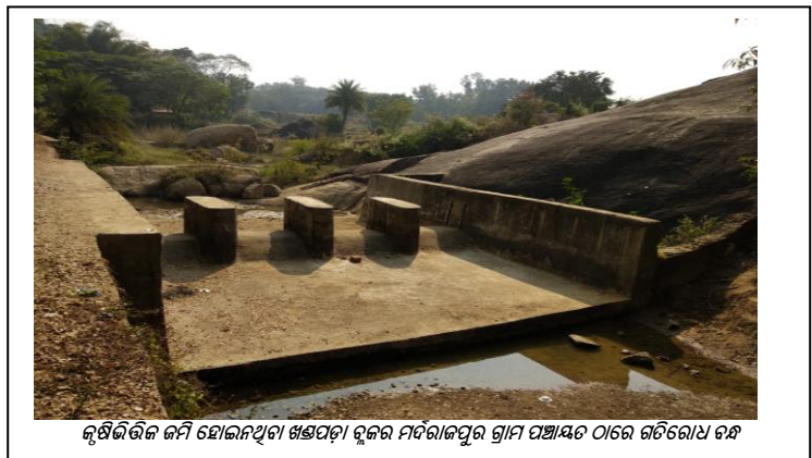
କୃଷିଭିତ୍ତିକ ଜମି ହୋଇନଥିବା ଖଣ୍ଡପଡ଼ା ବ୍ଲକର ମର୍ଦ୍ଦରାଜପୁର ଗ୍ରାମ ପଞ୍ଚାୟତ ଠାରେ ଗତିରୋଧ ବନ୍ଧ

ଏହିପରି ଭାବରେ, ଯୋଜନାଗତ ତୁଟି, ତୁଟିପୂର୍ଣ୍ଣ ଜାଗା ଚୟନ, ଭୁଲ୍ ନକ୍ସା ଏବଂ ଜାଗା ଚୟନ ପୂର୍ବରୁ କୃଷକମାନଙ୍କର ସଂପୃକ୍ତ ଅଭାବର ଫଳସ୍ୱରୂପ ଚେକ୍ ଡ୍ୟାମ୍ ଗୁଡ଼ିକ ଉପଯୋଗ ହୋଇପାରି ନଥିଲା, ଯାହାଫଳରେ 2.03 କୋଟି